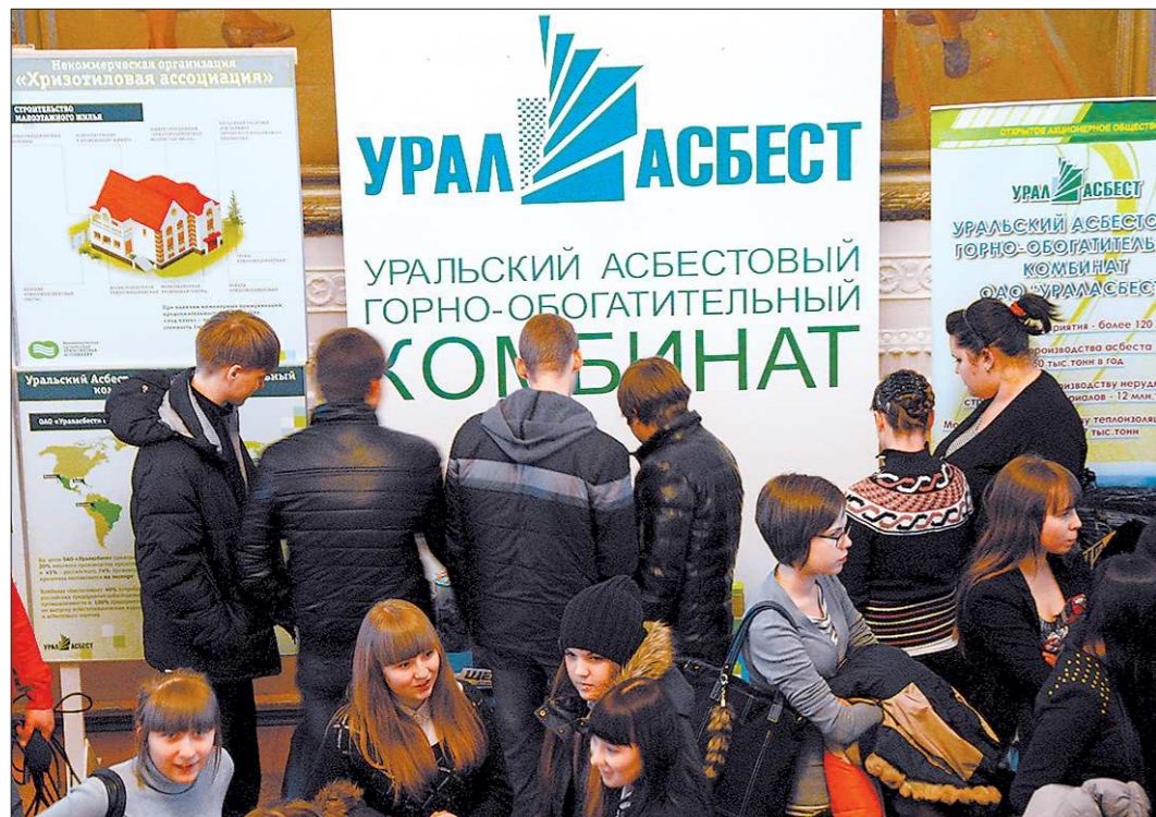
Социально-образовательный проект Асбестовского ГО «Молодёжь — будущее города» — пример эффективного повышения престижа профессий технического профиля для всей области

Лучше края нет на свете. Самый чудный из чудес Наш микрорайон кудель-асбест.