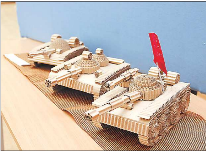
Подведены итоги областного детского конкурса «Сыны Отечества», который был посвящён 70-летию празднования победы в Сталинградской битве и 70-летию формирования Уральского добровольческого танкового корпуса. Учредителями конкурса выступили правительство Свердловской области, областное молодёжное правительство и Уральский