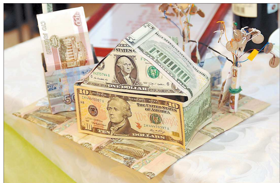
Подготовили Мария ЛЯНГ, Margarita ИЛЮШИНА