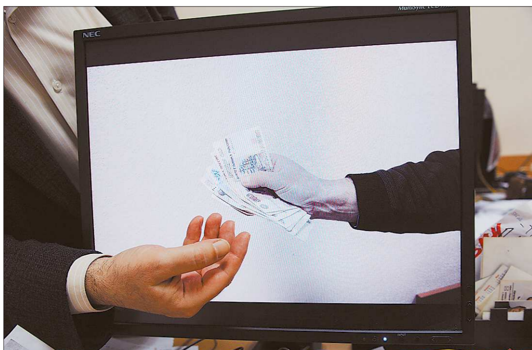
На возвращённые от покупки жилья, оплаты обучения или лечения средства новое жильё, конечно, не приобрести. Однако эти деньги станут хорошей прибавкой к семейному бюджету