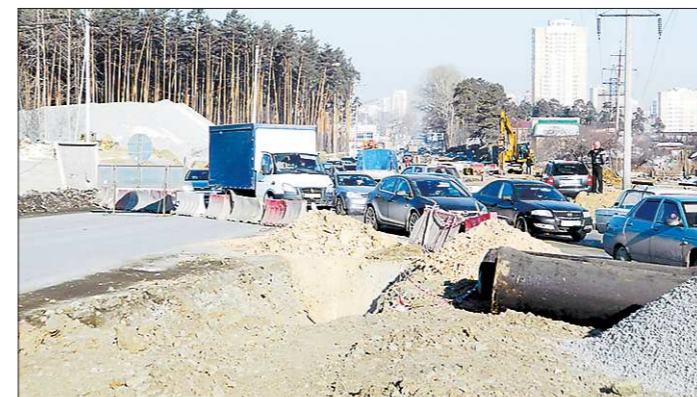
Трудности на Московской-Обьездной — временные

В связи со строительством развязки на перекрёстке Московской — Обьездная, на момент проведения работ изменилась схема организации дорожного движения. Перекрёсток оказался улиц Московской. Взамен создан объезд, по которому и будет осуществляться движение.