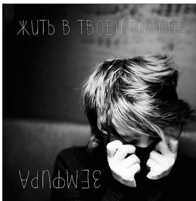
В новом альбоме Земфиры музыка отошла на второй план

Самое подходящее определение для нового звука Земфиры – минимализм. В связи с этим Земфиру можно заподозрить в конъюнктуре. Такой подход сейчас в моде. Успешные музыкальные