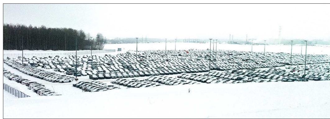
У автодилеров зачастую бизнес ведёт одна компания, а основные активы находятся в собственности подконтрольных ей лиц, которые платят минимальные налоги и не попадают под критерии отбора для выездных налоговых проверок

горий граждан, и объяснил, что Свердловское агентство ипотечного жилищного кредитования ищет разные механизмы для завершения строительства проблемных домов. Находит инвесторов к недостроенным площадкам. Помогает старым инвесторам находить финансирование для продолжения строительства. Выделяет займы в виде траншей. Контролирует ход строительства, чтобы как можно быстрее вывести его из «замороженного» состояния.