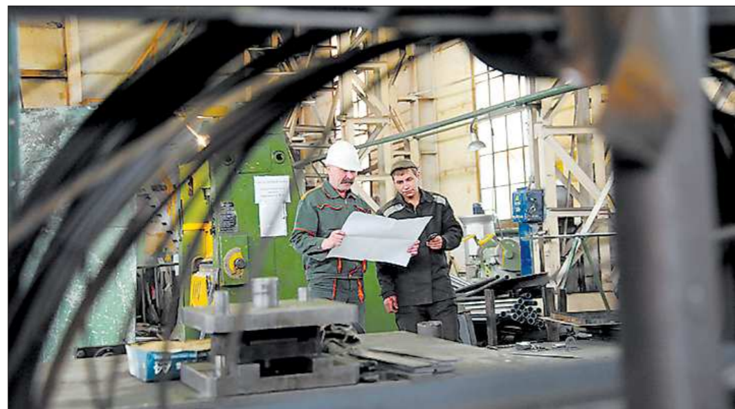
На предприятиях-резидентах ИП «Синарский», площадь которого 23 гектара, работают уже почти четыре тысячи человек

«Мы делаем трубы, а вся механическая обработка, которую выполнял этот завод, теперь по аутсорсингу нам стоит дешевле. Перейдя на режим самовыживаемости, он начал внедрять серьёзные инвестиционные программы», – ответил глава «СинТЗ» и управляющей ком-