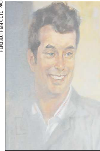
Этот портрет висит у Королёва дома, а раньше был в заводском музее. Музей закрыли, и друзья, чтобы картина не затерялась, привезли её орденосецу

знание, сначала орден Трудового Красного Знамени, а потом орден Ленина, получил в семидесятые годы, будучи конструктором и главным конструктором Уралмашзавода, за созда-