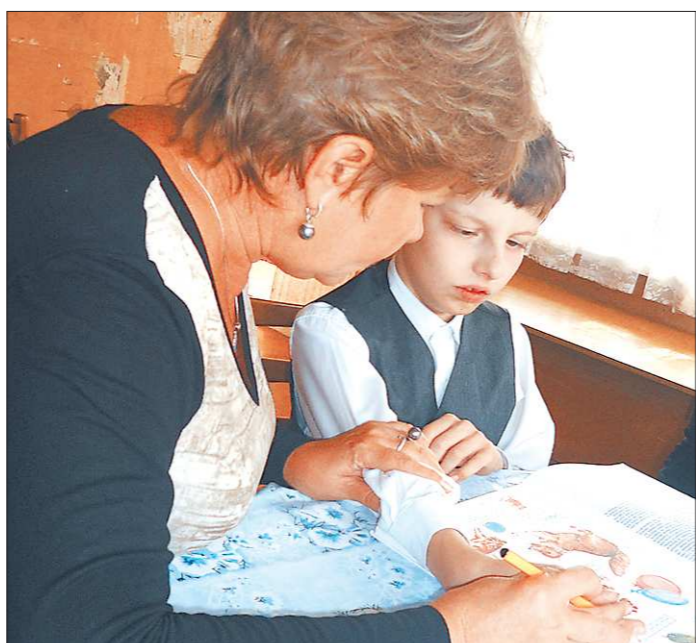
Чтобы организовать рабочее место для ребёнка и учителя, нужно не только купить компьютеры, провести Интернет, но и обеспечить того и другого специальными образовательными программами