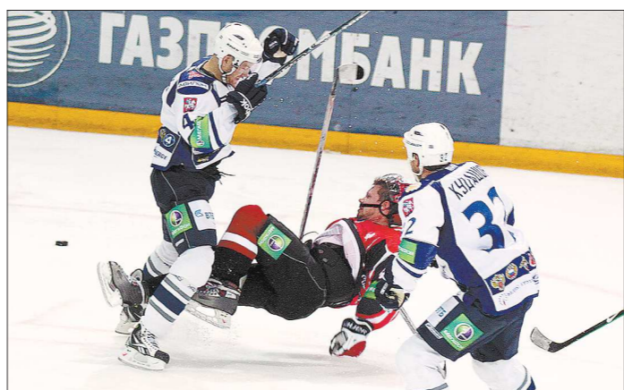
В этом сезоне «Автомобилист» упал на самое дно

С 2014 года, согласно изменениям, внесённым в жилищный кодекс РФ в декабре 2012 года, капитальный ремонт будет финансироваться из региональных фондов, сформированных за счёт средств собственников жилья. Подробнее о грядущих изменениях мы расскажем в следующем номере «ОГ».