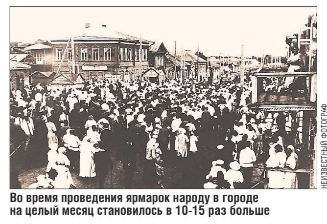
Во время проведения ярмарок народу в городе на целый месяц становилось в 10-15 раз больше