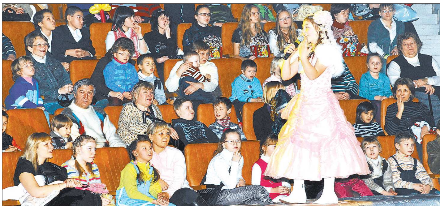
Екатеринбургский цирк приглашает детей из детдомов, малоимущих и многодетных семей на новогоднюю ёлку. В остальное время льготы ребятишкам из больших семей учреждением не предоставляет

Все предложения передаются на рассмотрение в правительство области.