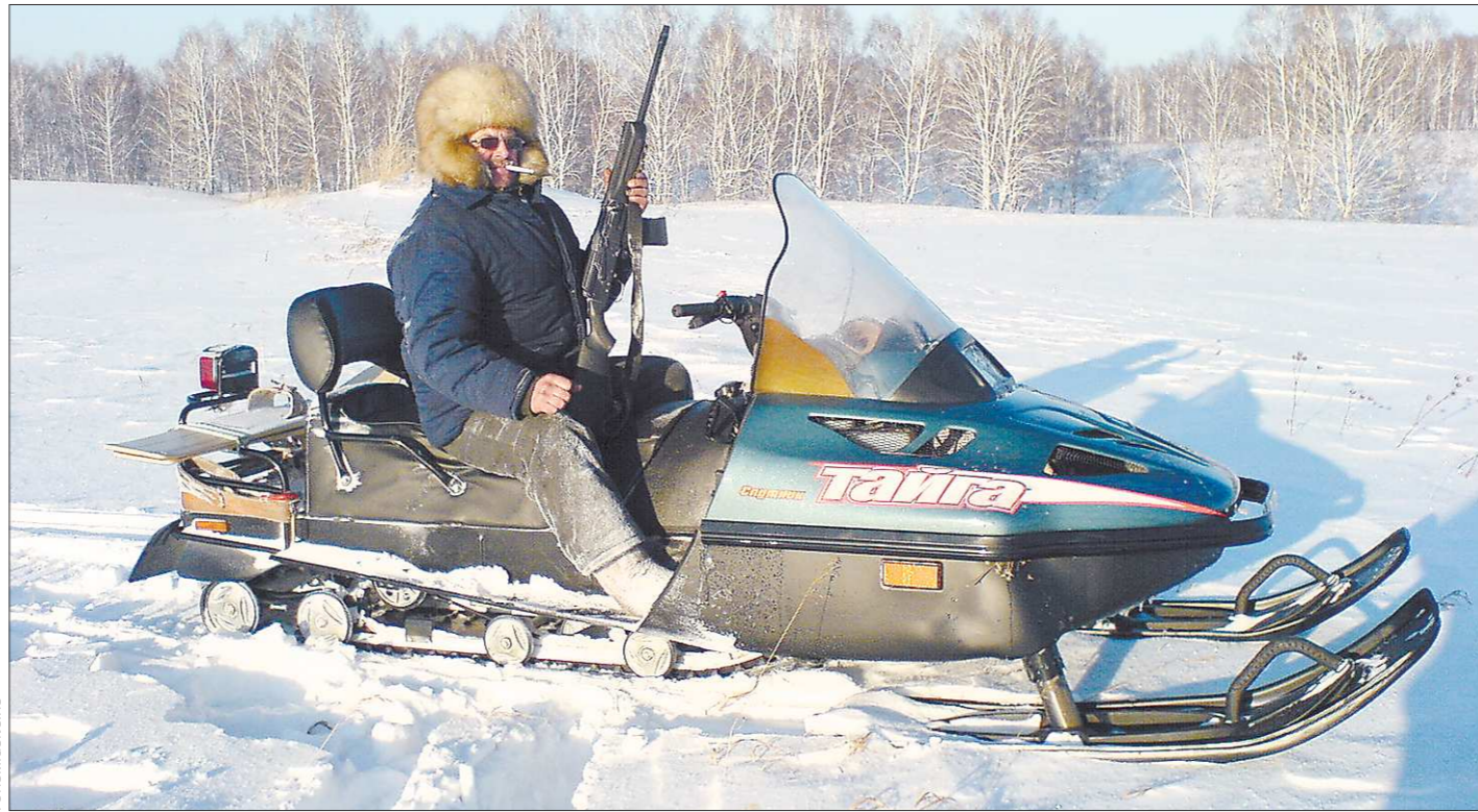
Будучи примерно так оснащён и вооружён, станет опасен охотинспектор для браконьеров

С принятием нового закона будет поставлен заслон махинациям. Эксперты и депутаты также считают, что возможности применения маткапитала надо расширить, разрешив использовать его на повседневные нужды, что особенно актуально для многодетных семей, а также на приобретение автомобиля, отдых, лечение. Есть предложения и вовсе радикальные – выдавать маткапитал «живыми» деньгами особо нуждающимся семьям.