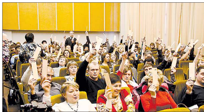
Ставлю вопрос на голосование. Кто за введение института сити-менеджера?

ВМЕСТЕ www.uralinfoport.ru, сайт региональных СМИ