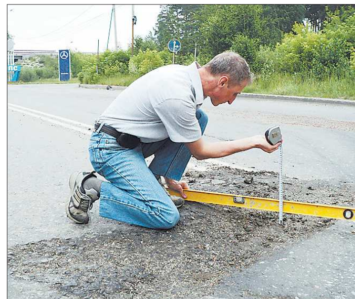
С помощью таких нехитрых измерительных приборов можно довести дело до суда

Как пояснили «ОГ» в пресс-службе областного суда, вынесено определение, согласно которому жалоба заявителей удовлет-