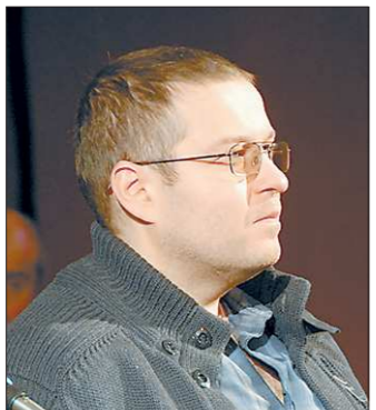
Эдуард Веркин – «Облачный полк»