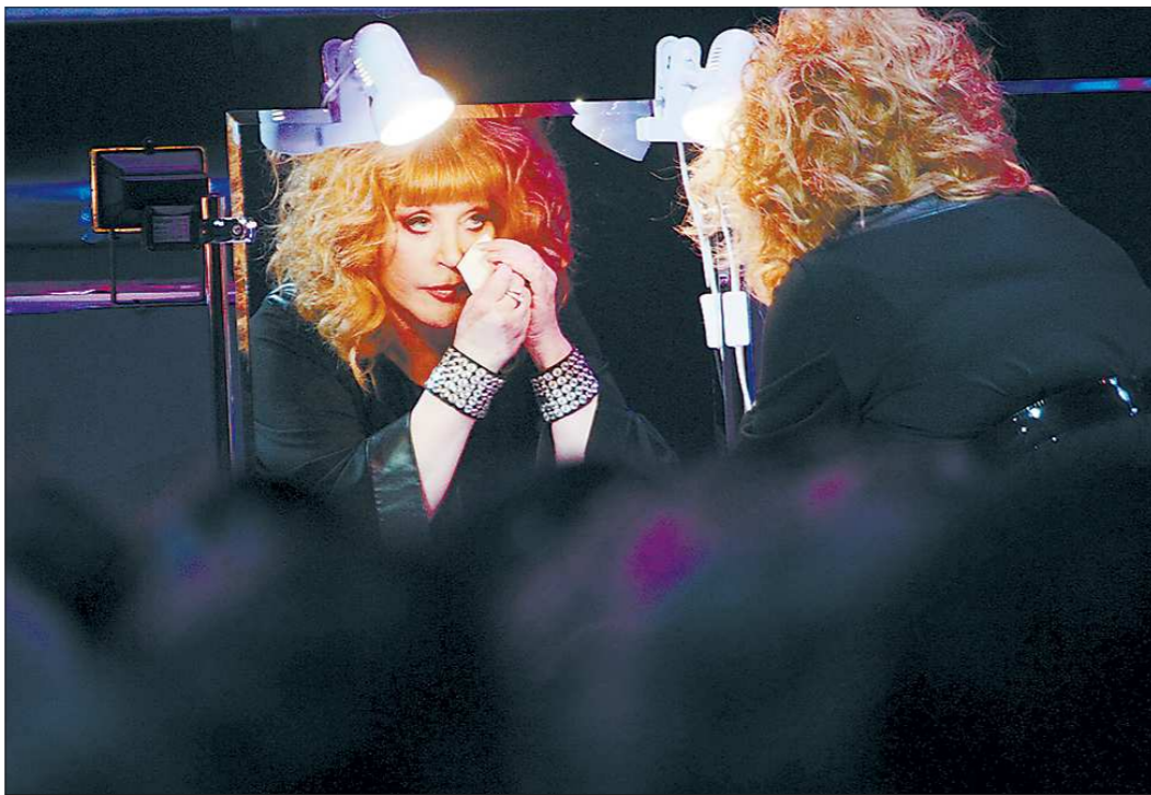
Алла Пугачёва к «Рождественским встречам» приготовила сразу несколько сюрпризов своим поклонникам – похудела, помолодела, похорошела. И спела! Четыре новые песни и хорошо забытую старую «Ты не стал судьбой»

И в самом деле, после того как «Песня года» перестала быть монополистом в этой сфере, а в последнее время и вовсе перестала быть по-настоящему заметной в новогоднем телекалейдоскопе, пожалуй, именно «Золотой граммофон» подхватил у неё эстафетную палочку главной песенной программы страны. И ни «Лучшие песни», ни «20-ка лучших песен 2012», ни окончательно растерявшая былую популярность «Песня года» по большому счёту ему не конкуренты.