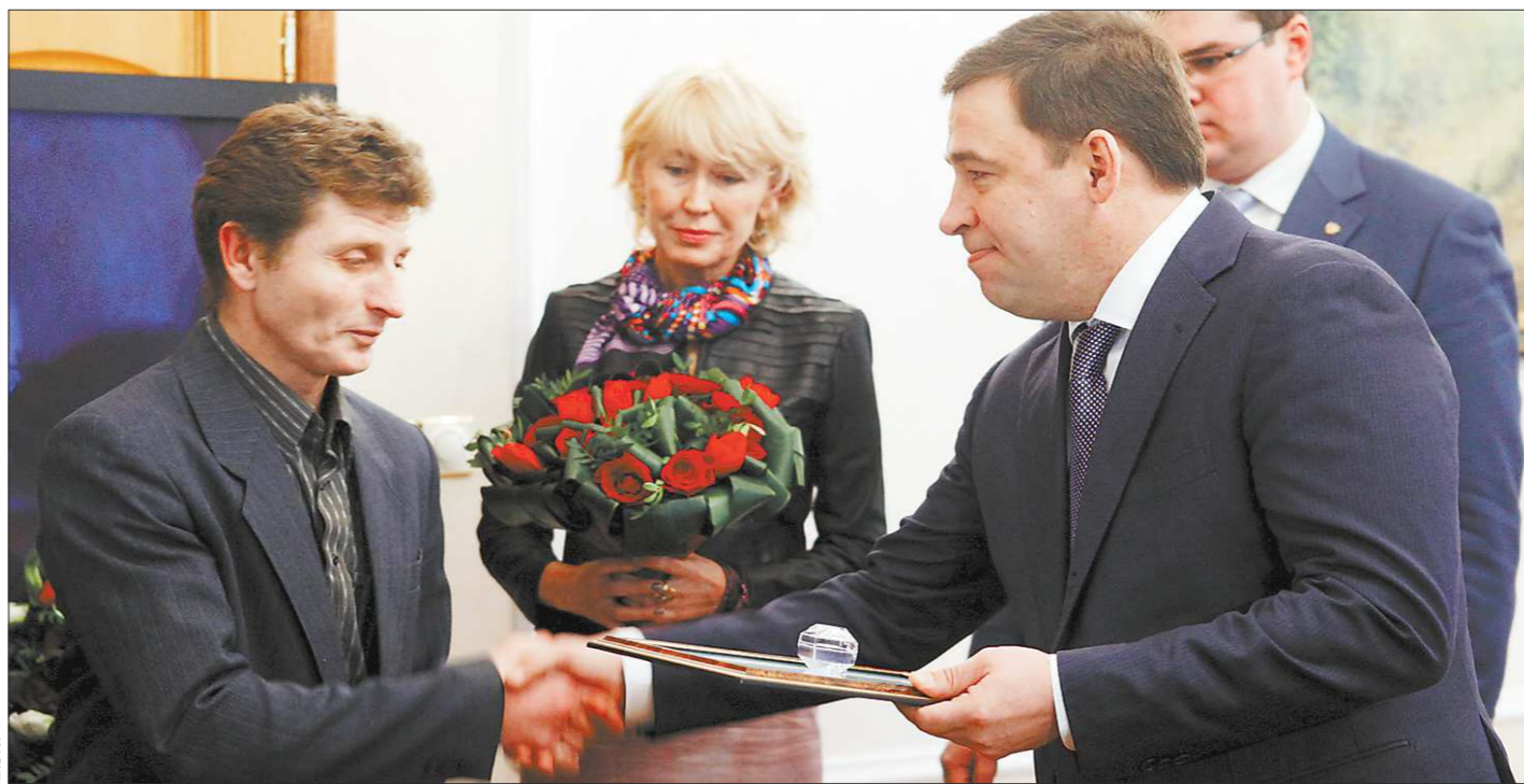
ПРЕСС-СПЕЦИАЛ Губернатора Свердловской области