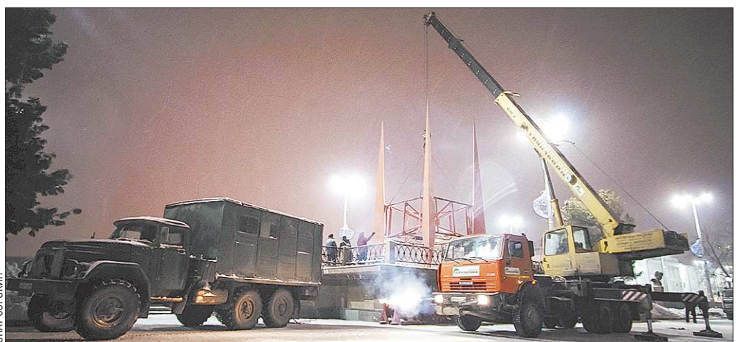
Шпили «Краснознамённой группы» появились на Плотинке в 1973 году как ансамбль

ный и Сосьва, на равнинном участке, поросшем смешанным лесом. Точные координаты географического центра Среднего Урала – 58 градусов 59,86 минуты северной широты и 61 градус 44,51 минуты восточной долготы. Расстояние до Екатеринбурга – почти четыре сотни километров.