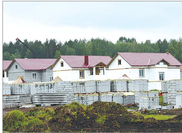
Мощности по производству кирпича загружены все на 50 процентов

+/- — рост / падение по отношению к предыдущему показателю