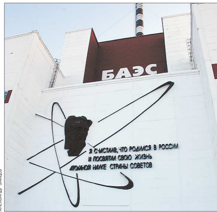
Белоярская атомная электростанция была введена в эксплуатацию в 1964 году. Спустя почти полвека в Свердловской области открылся первый класс атомного просвещения