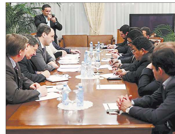
Инвестиционный интерес подтолкнул к переговорам представителей Свердловской области и Никарагуа

Кроме того, заместитель министра иностранных дел Республики Никарагуа Вальдрак Хаентске вчера