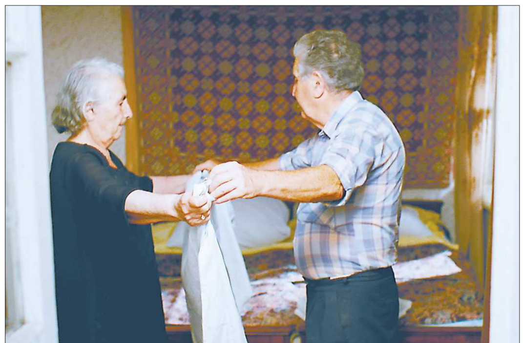
Герой фильма «В путь» – настоящий художник – подмечает все мелочи жизни

– Нет, всё нормально! Уж лучше отменить соревнования, чем «дёргать» под дождём в плюс 15. Зато есть время в нормальных условиях потренироваться дома.