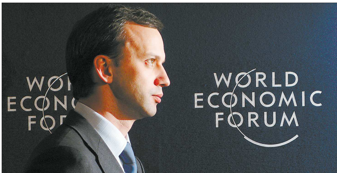
Аркадий Дворкович уверен, что экономический форум в Давосе — отличная возможность показать крупным международным инвесторам, что Россия открыта для них и готова сотрудничать