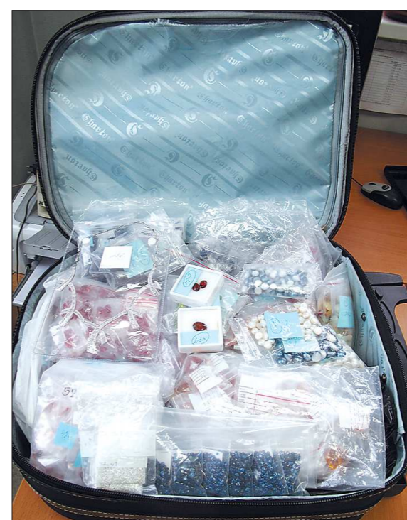
Эти 25 килограммов драгоценностей на сумму девять миллионов рублей пытался вывезти из Таиланда в Россию турист из Екатеринбурга. Теперь ему грозит крупный штраф за контрабанду

В основном таможенники сейчас беспокоит вал транспортировки контрафактных товаров из Китая. Поддельную «фирменную» одежду и обувь по решению суда конфискуют и, как правило, передают в детские дома и социальные службы. (Кстати, то, что предлагают некоторые магазины под видом таможенного конфиската, к таможне никакого отношения не имеет. Там продают нечто иное). Недавно задержали больше миллиона пробок для производимой в России водки известных марок. Всю партию этих колпачков арестовали, а затем с помощью правоохранительных органов выявили и прикрыли сам завод по розливу водки.