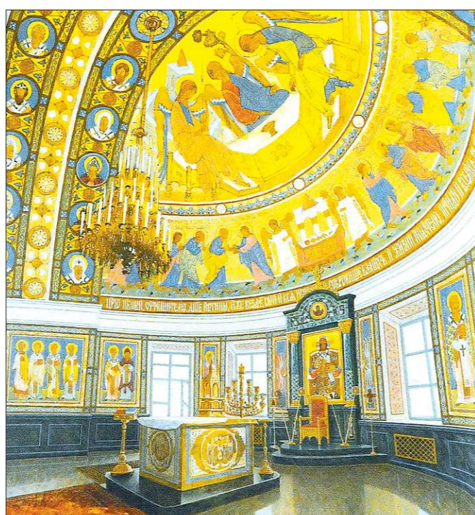
Одна из работ, выдвинутых на соискание губернаторской премии – роспись Свято-Троицкого кафедрального собора в Екатеринбурге

Кроме «красного уголка» и раздевалки здесь был ещё кабинет бригадира тепличного хозяйства. Крепкое, хоть и советское ещё, строение. Электропроводку им осенью перед заселением поменяли, всё оборудование проверили. Обогреватели были новые и технически исправные. Это нам рассказал уже случайно встреченный электрик этого хозяйства, тоже попросивший не называть его имя в газете.