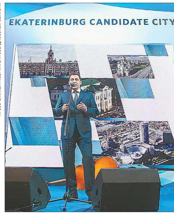
Евгений Куйвашев презентует заявку уральской столицы на проведение ЭКСПО-2020 послам стран, представленных в России