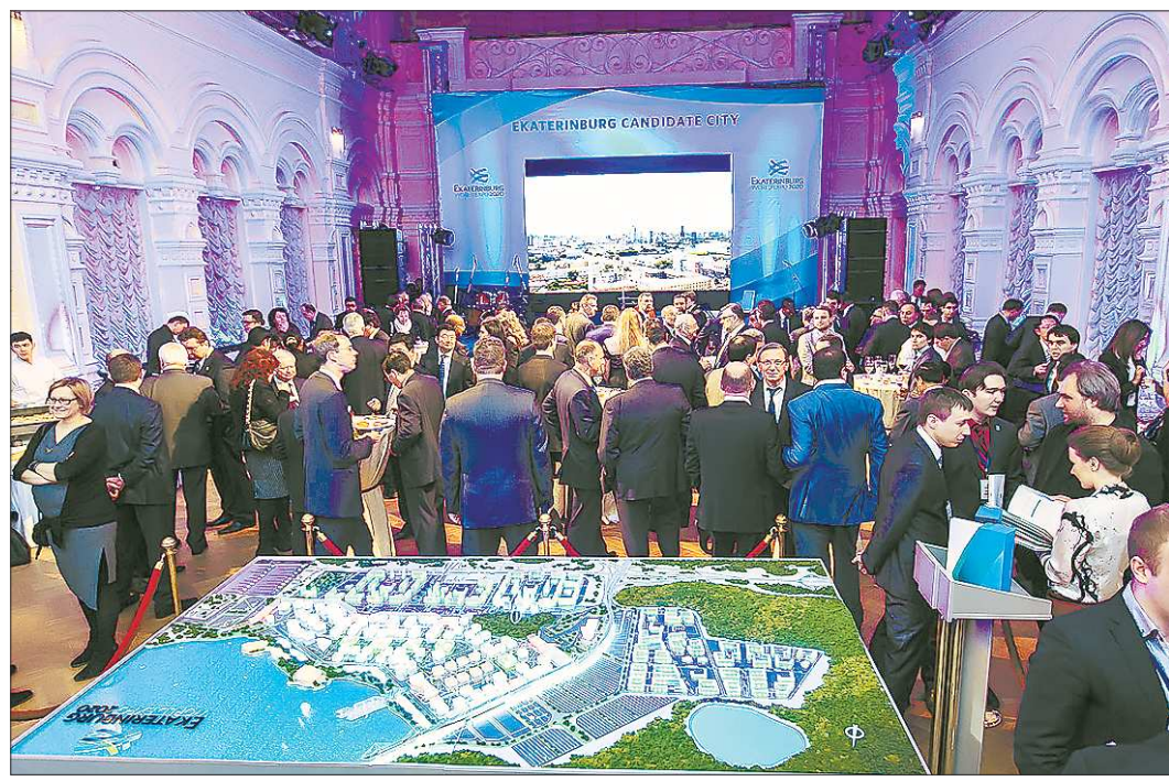
Евгений Куйвашев презентует заявку уральской столицы на проведение ЭКСПО-2020 послам стран, представленных в России