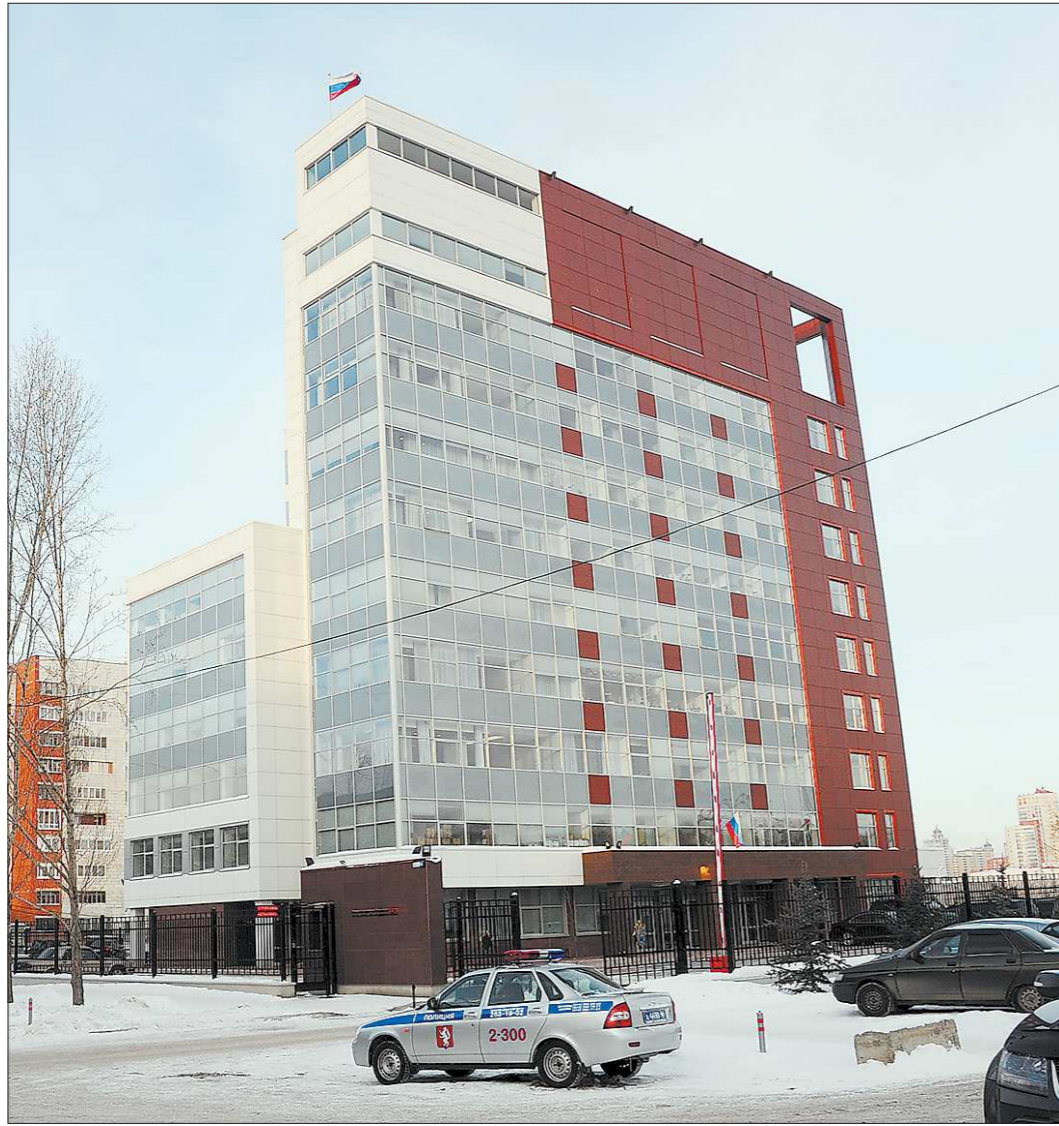
Вот эти стены должны помочь теперь нашим следователям

Экскурсию по кабинетам следователей вчера журналистам не проводили. Здесь в принципе не любят лишних глаз: в каждом кабинете — служебная информация, за которую преступники дали бы очень дорого. Поэтому — смотрите, дорогие го-