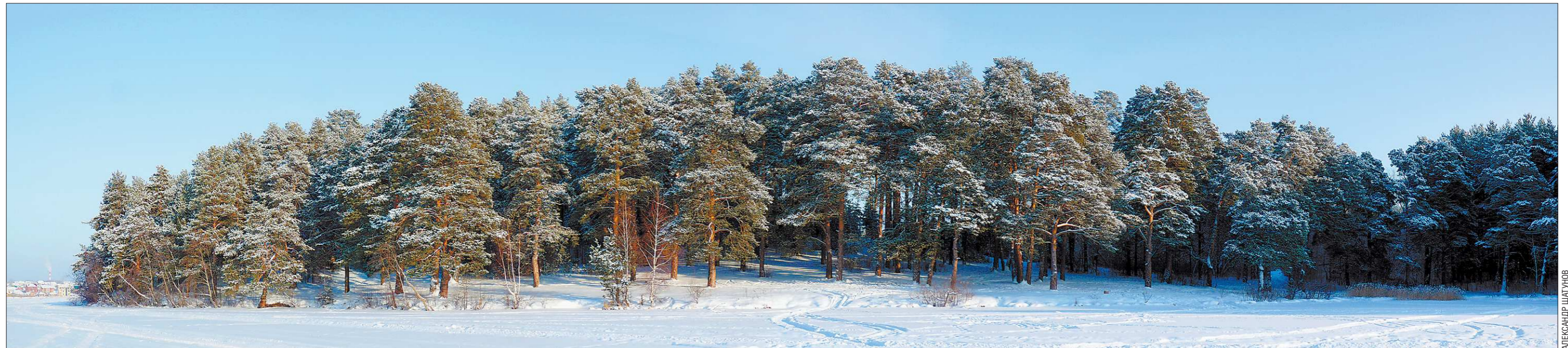
Как уверяет сысертское руководство, на отвоёванном у иностранцев берегу местного пруда всё-таки организуют освещённую лыжную трассу

Теперь жители выносят мусор, когда им удобно, а не по строгому расписанию. Пока за площадками не закреплены ответственные дворники, которые будут следить за наполняемостью контейнеров. И всё же жители отмечают, что порядка в посёлке стало больше. Анна АНДРЕЕВА