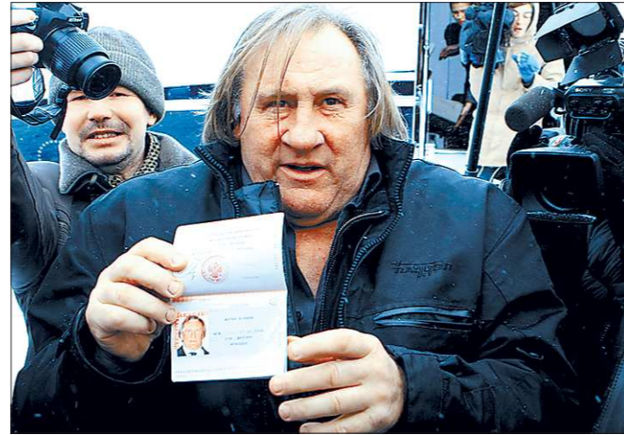
5 января 2013 года. Жерар Депардьё демонстрирует журналистам только что полученный российский паспорт

А насчёт высокого налога с богатых, из-за чего закрылись вся эта история, скажу так. Сегодня ты бедный и захотел стать богатым. Ты не валялся на диване, не пил водку, крутился как белка в колесе, работал как вол с утра до ночи. Заработал себе средства на хорошую жизнь – и отдай половину? С чего вдруг? Тогда уж лучше лежать на диване, пить водку – и никому ничего не будешь должен. По-