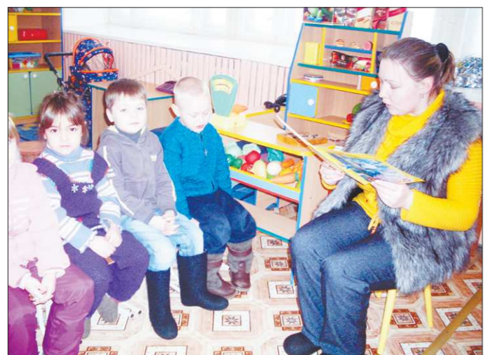
АРМВ ДЕТСКОГО САДА С. ГАЛКИНСКОЕ

Из-за проблем с котельной в селе Галкинском детский сад посещает только треть воспитанников