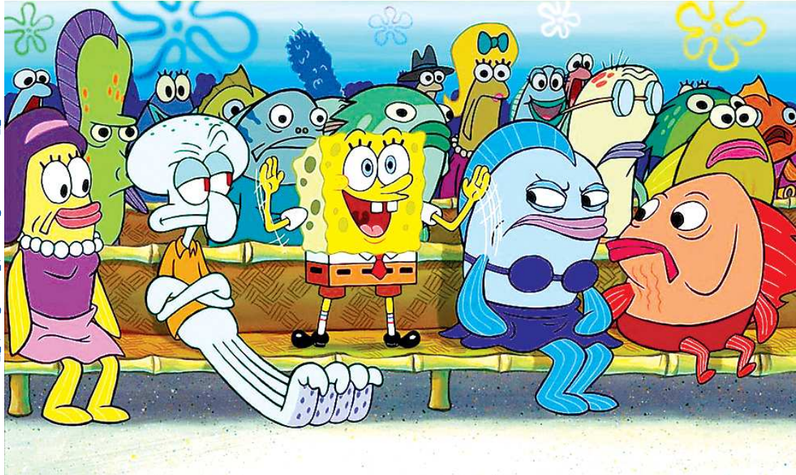
«Это чувство, когда во время контрольной ты вспомнил всё...»

Многие используют всем хорошо знакомый метод ассоциаций, когда слова или цифры сравниваются с хорошо знакомым предметом. Но тут следует опираться на индивидуальные особенности и свой тип памяти. Кто-то лучше