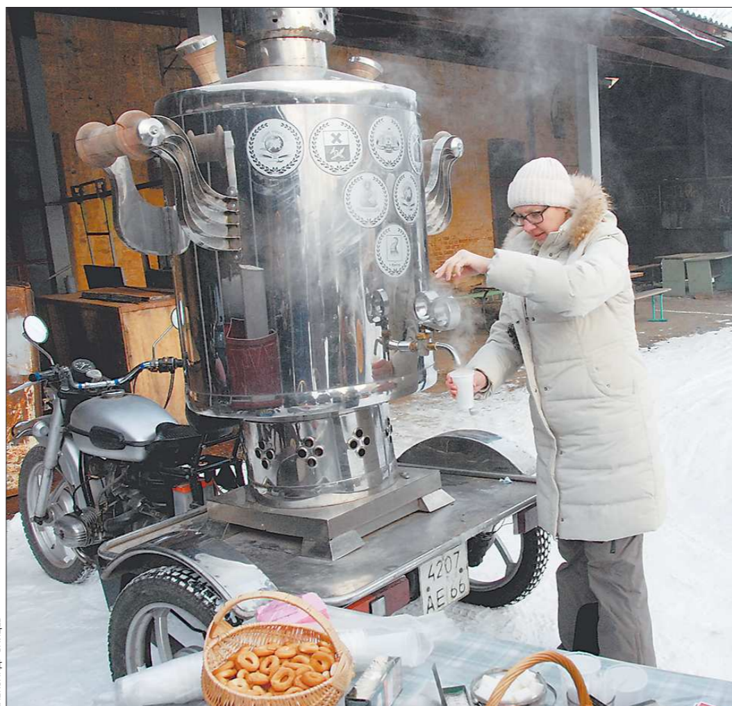
В Ирбите гостей напоили чаем из самого большого в мире самовара ёмкостью 415 литров. Огромный самоходный самовар – визитная карточка здешнего Музея народного быта

Туристы, которые к нам сейчас приезжают, стараются всё осмотреть в течение одного дня, а у нас столько интересного, что нужно организовывать многодневные туры. Но при этом необходимо обеспечить достой-