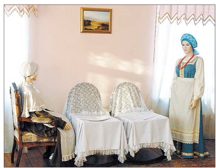
Сказочные пейзажи Нижней Синячихи, блинный дух русской печи в ирбитском Музее народного быта, нежная тишина детской комнаты в алапаевском доме Чайковских... Эти и ещё множество увиденных и «прочувствованных» во время поездки картин – словно кадры документального фильма о нашем милом общем прошлом