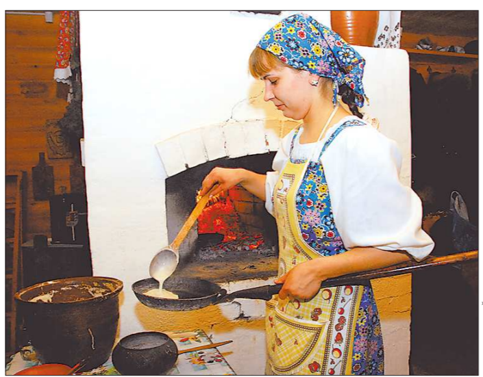
Сказочные пейзажи Нижней Синячихи, блинный дух русской печи в ирбитском Музее народного быта, нежная тишина детской комнаты в алапаевском доме Чайковских... Эти и ещё множество увиденных и «прочувствованных» во время поездки картин – словно кадры документального фильма о нашем милом общем прошлом