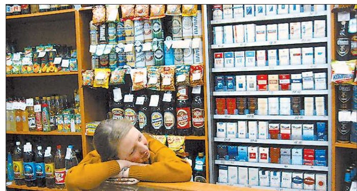
Торговля пивом и сигаретами больших усилий не требовала. Теперь представителям малого бизнеса придётся искать новые сферы приложения своих предпринимательских способностей

+/- — рост / падение по отношению к предыдущему показателю