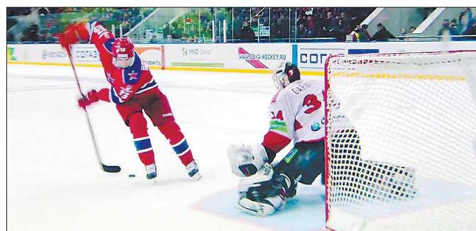
потом перевёл её себе за спину...