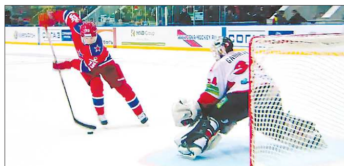
Форвард сначала убрал шайбу вправо...

Уроженец Екатеринбурга Павел Дацюк, выступавший до нынешней недели за московский ЦСКА, 6 января в поединке с челябинским «Трактором» в послематчевой серии буллитов забил потрясающий гол.