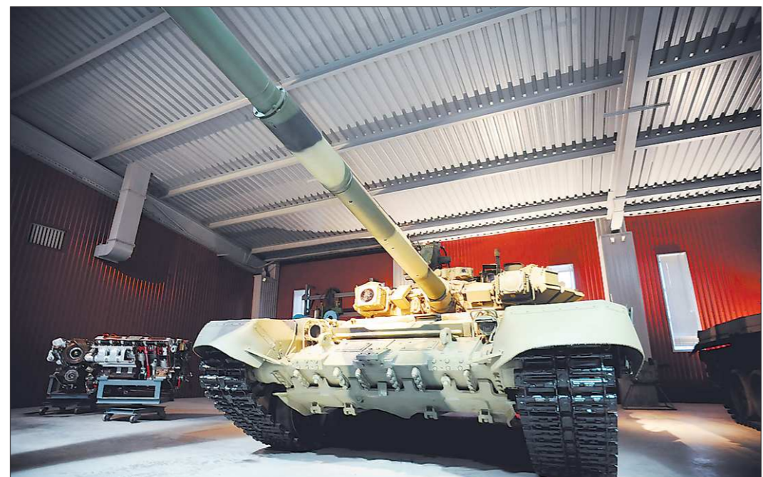
По словам экскурсовода, дети – более пытливые посетители. Взрослым и в голову не приходит, а ребята задаётся вопросом: как самозакрывающиеся танки после того, как зароятся, выезжают снова на белый свет, сколько в них лошадиных сил?