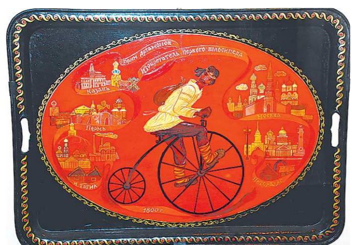
Тагильские подносы получили известность по всему миру. Их приносили в дар князьям, царям и европейским королям