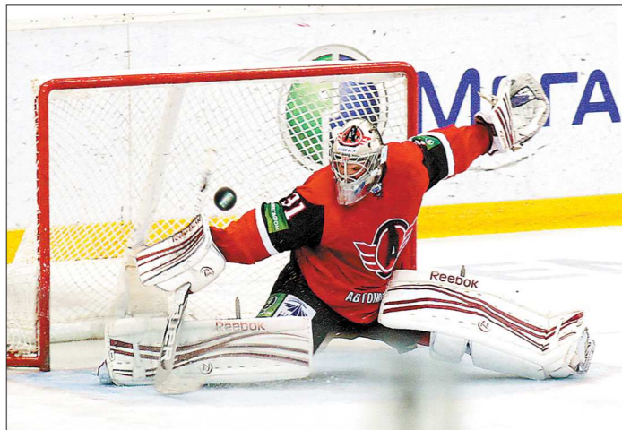
Болельщики «Автомобилиста» чаще всех в КХЛ видят забитые шайбы в ворота своей команды