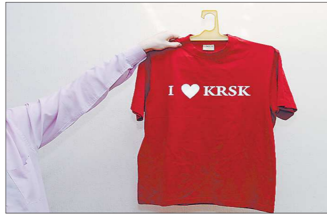
В Красноуфимске можно даже приобрести футболки с упоминанием народного имени города на английском языке