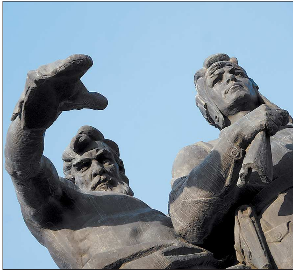
В феврале 1962 года на Привокзальной площади Свердловска был открыт памятник Уральскому добровольческому танковому корпусу. Через 50 лет монумент прогремел на всю страну – после того, как рядом с ним состоялся знаменитый митинг, на котором рабочие области высказались в поддержку Владимира Путина как своего кандидата в президенты страны