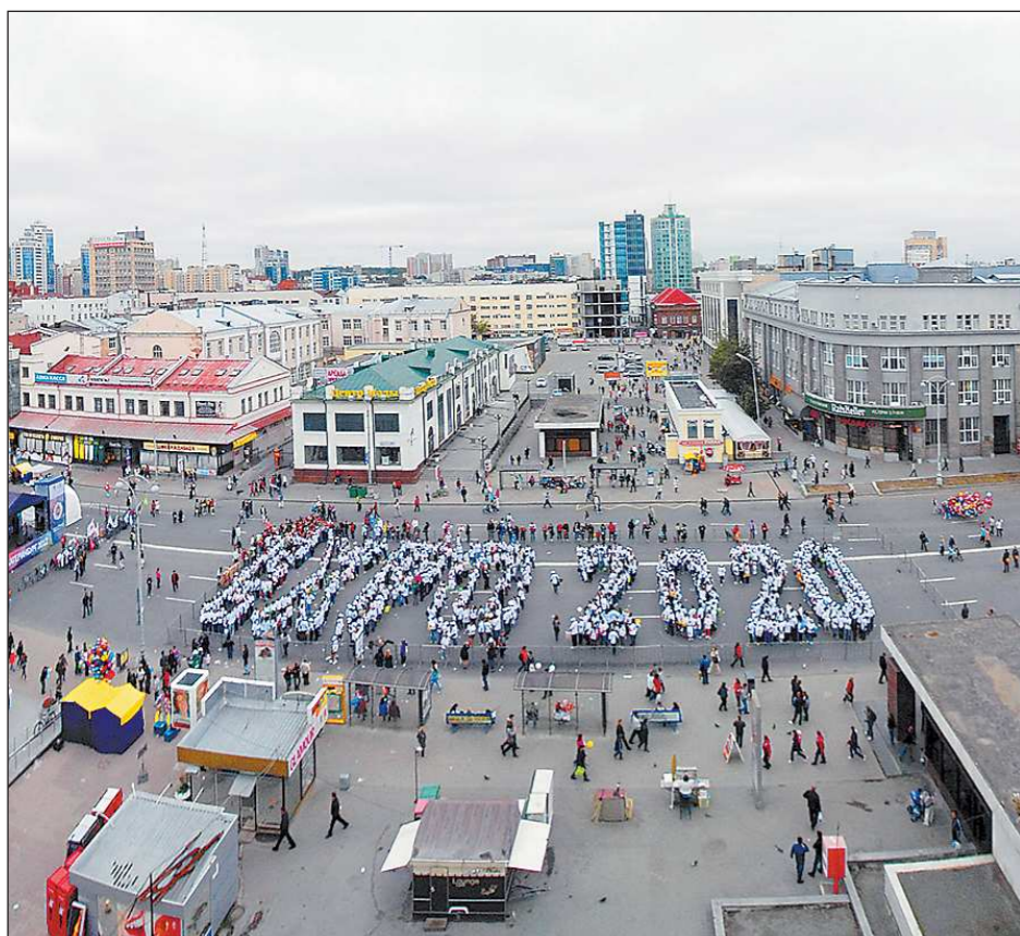
В октябре-ноябре 2013 года Бюро международных выставок должно определить, где состоится ЭКСПО-2020. Соперниками у Екатеринбурга четыре – бразильский Сан-Паулу, турецкий Измир, тайландская Аюутхая и Дубай (ОАЭ)