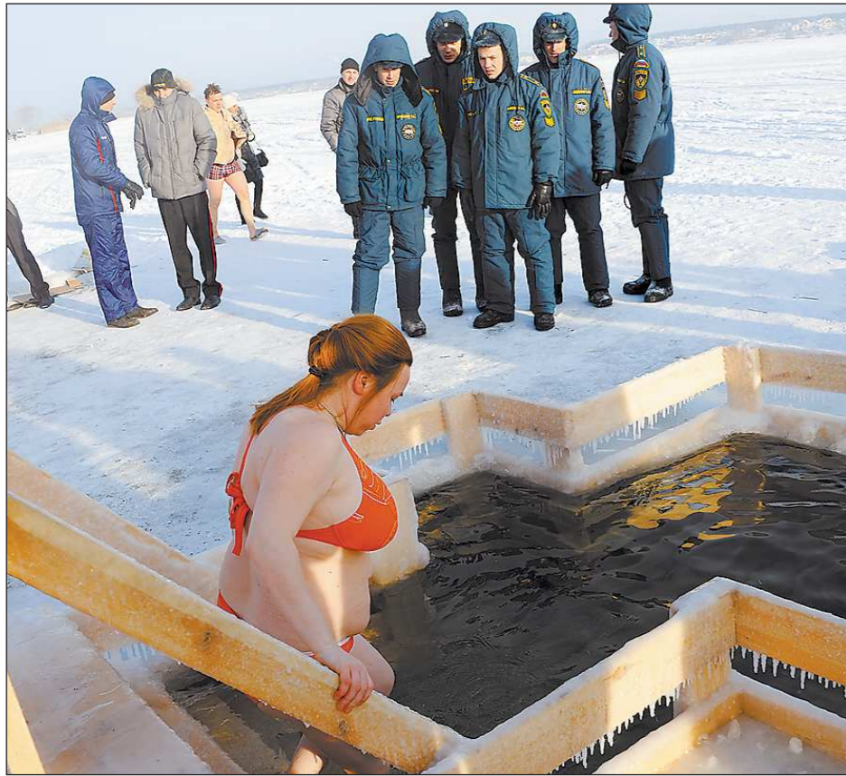
Крещенские купания на Урале проходят под пристальным наблюдением МЧС