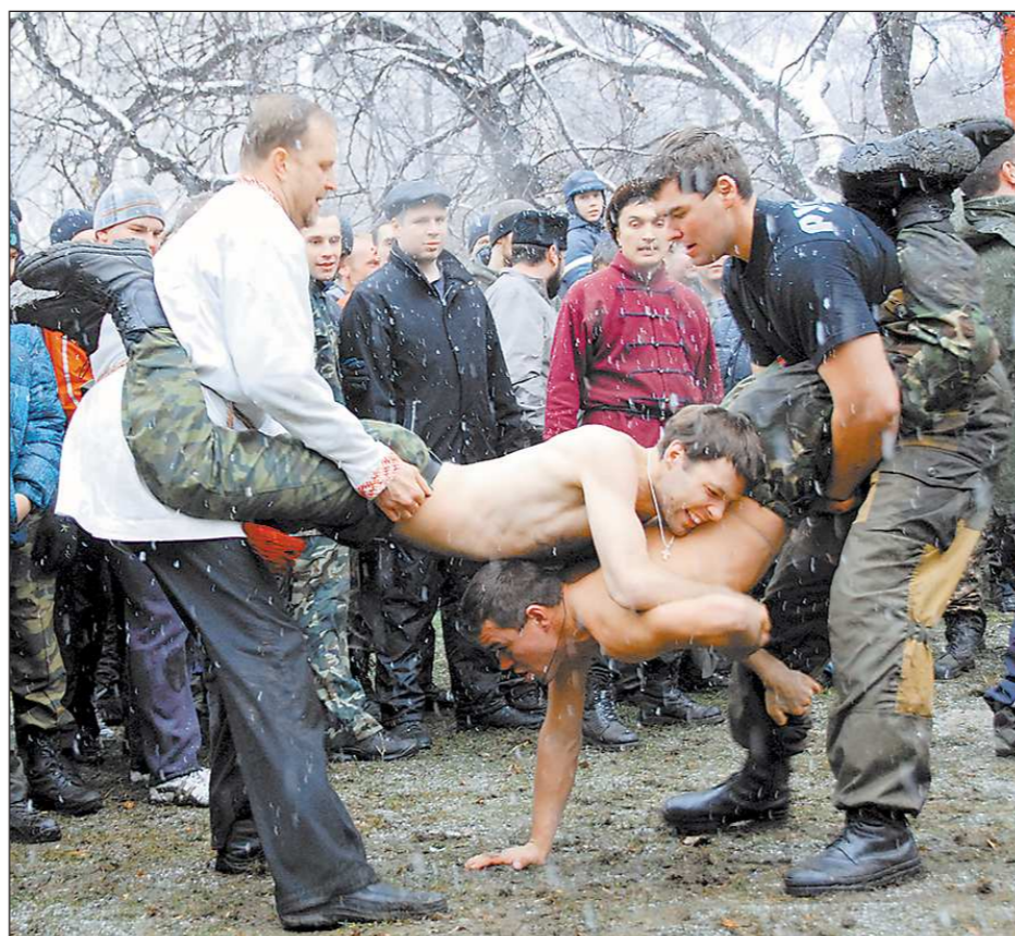
Фестиваль традиционной мужской культуры «Дмитриев день» проходит 8 ноября