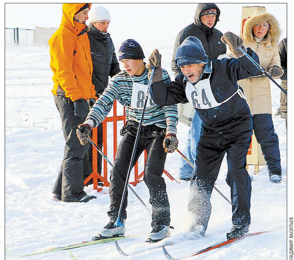
В декабре в пяти местах области – Екатеринбурге, Красноуральске, Североуральске, Новой Лиле и посёлке Октябрьский Камышловского района – проходят лыжные соревнования среди непрофессиональных спортсменов на призы «Областной газеты». На трассы выходят люди всех возрастов – от детского до «золотого», так что такие картины на финише – когда юноши соперничают за победу со стариками – совсем не редкость