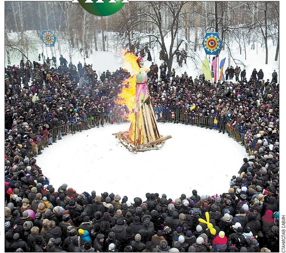
Масленница в 2013 году пройдет с 11 по 17 марта