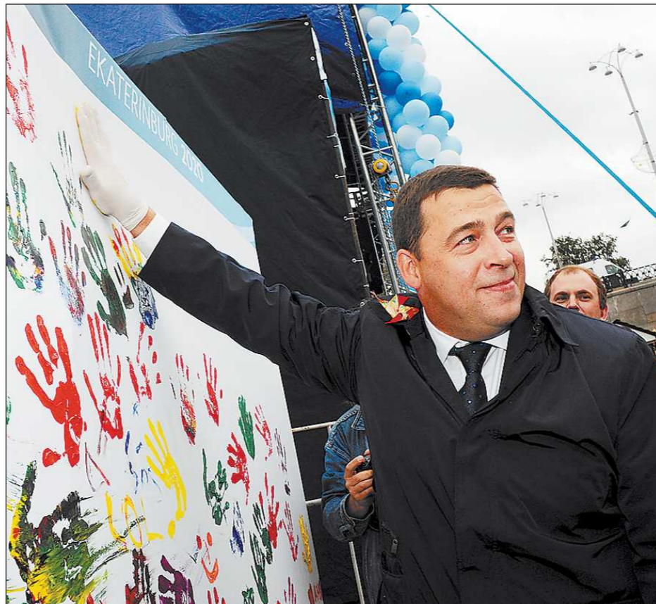
В мае 2012 года у Свердловской области появился третий по счёту губернатор. Им стал Евгений Куйвашев