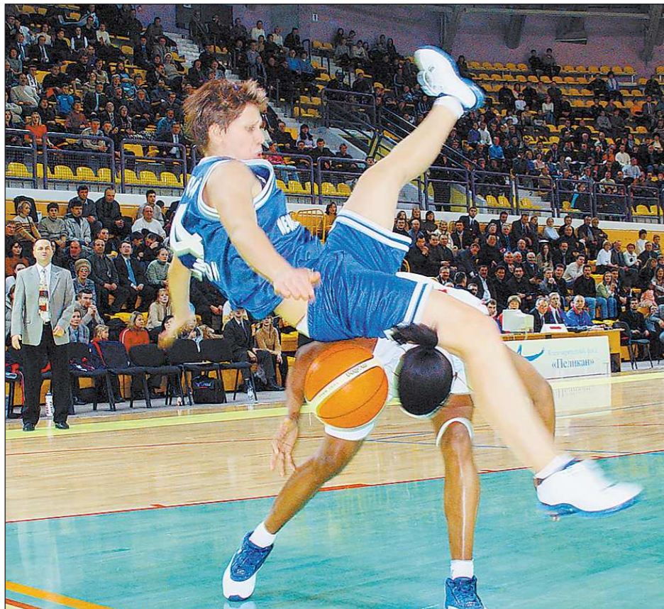
В апреле 2003 года баскетбольный клуб «УГМК» выиграл клубный чемпионат Европы – женскую Евролигу. В 2013-м у «лисиц» есть шанс повторить этот успех: решающий раунд соревнований пройдет в Екатеринбурге