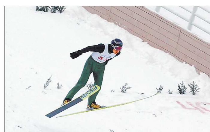
Сорок летающих лыжников опробовали новый комплекс трамплинов в день его открытия

— Проблемы есть везде. Если взять, к примеру, предприятия, находящиеся в собственности Свердловской области, то многие руководители управляли ими, почти ничего не вкладывая в модернизацию. Наши птицефабрики сохранили имущество и объёмы производства, но соседи скакнули по количеству и качеству в разы, а мы, стоя на месте, оказались в хвосте. Нас просто выкинул с рынка. Что можно сделать в этой ситуации, когда другие ушли далеко вперед?