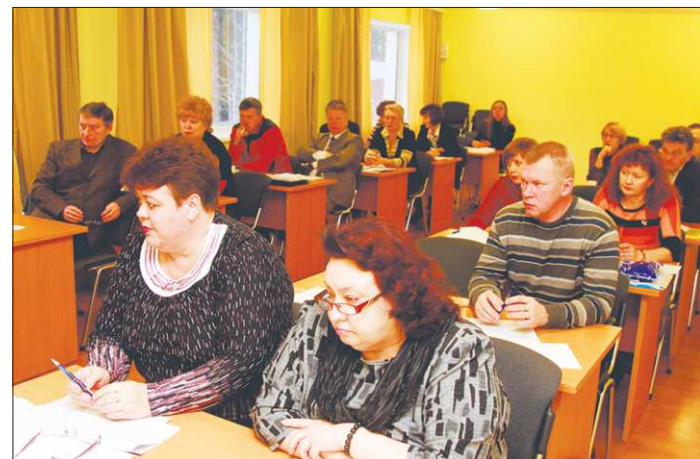
Обл. избирком может усадить за парты даже взрослых

— Непредвиденных ситуаций действительно возникает много. Мы говорили о путях выхода из них и о том, чтобы в дальнейшем они не повторялись. У нас в Берёзовском в последние два года была череда выборов — главы, депутатов местного представительного органа. Мы их провели успешно. Но неординарные случаи возникали. Например, после