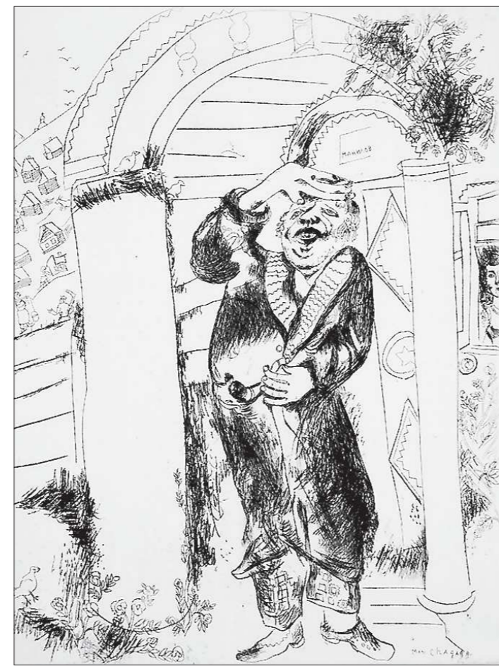
Гротеск — главная интонация художника, осмелившегося проиллюстрировать одно из самых знаковых произведений русской литературы

В одной из глав речь идёт о причинах проведения выставки именно в Екатеринбурге, а не в каком-либо другом месте.