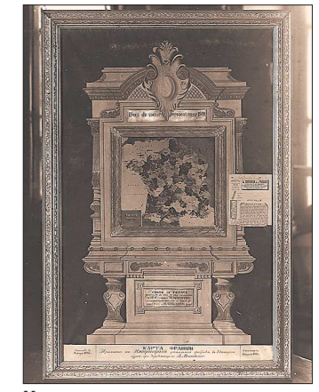
Нынешнее местонахождение уникальной карты Франции неизвестно, сохранился только этот снимок

Екатеринбургская гранитная фабрика выпускала табакерки, чарки, подносы, вазы, чаши, обелиски, камни, торшеры, пепельницы и прочие изделия из камня. Со временем уральским мастерам стали доверять уникальные изделия, например, для Всемирной выставки 1900 года из драгоценных камней была изготовлена карта Франции, которая имела большой успех.