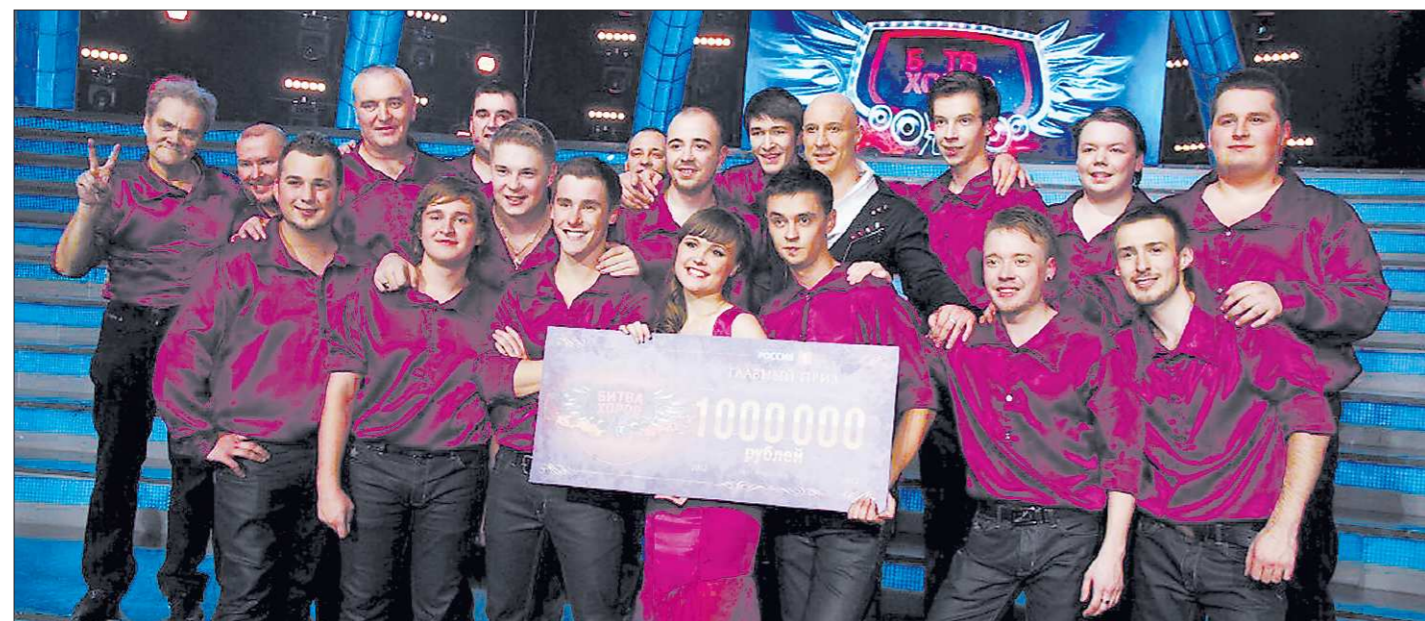
Выигранный миллион участники хора «Виктория» уже разделили. Сумму рассчитали вплоть до рубля – 52 тысячи 361 рубль