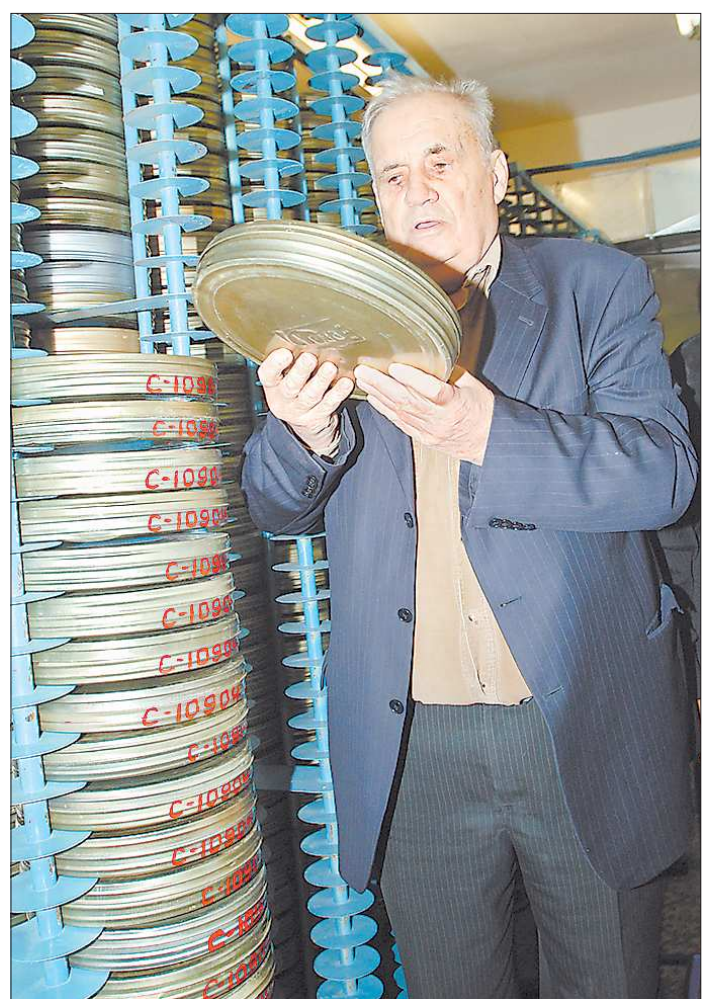
Эльдар Рязанов во время переноса своих фильмов в новое здание фильмохранилища Госфильмофонда в Белых Столбах

...В декабре 1994 года в составе телевизионной группы, снимающей для ЦТ новогоднюю и рождественскую программы, Рязанов, популярный ведущий «Кинопанорамы», отправился в поездку по Уралу и Сибири. Вот как вспоминает он об этом в книге «Неповедённые итоги»: «В Нижнем Тагиле я попросил отвести меня на окраину города в посёлок Красный Камень, где я, будучи пятнадцатилетним парнем, прожил с семьёй целый год в эвакуации. Барак, в котором мы размещались, находился между концлагерем и железнодорожной сортировочной станцией «Смычка». Пейзаж, конечно, изменился. И я не смог точно определить, в котором именно из четырёх сохранившихся барачных корпусов я жил... И, конечно, шла работа на сортировочной станции. Доносились голоса диспетчеров через динамики. Я испытал удивительное чувство – снова побывать там, где ты жил 52 года назад. Посещение этого места оказалось мощным толчком для памяти. Вдруг всплыло множество подробностей трудной эвакуационной жизни, тяжело обречённого бытия. И казалось, что всё это случилось в другой жизни, да и не в моей, а какого-то другого человека...»