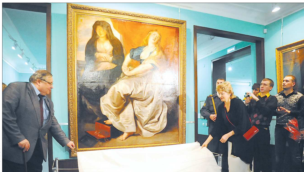
Сначала шедевр планировали выставить в раме со стеклом, но когда её устанавливали, верёвка лопнула – стекло разбилось. Сейчас для неё изготавливается специальное небьющееся стекло