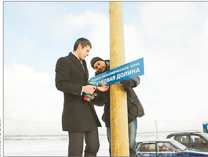
Отсюда начнётся «Титановая долина», правда, название главной улице ещё не придумали. Идеи принимаются!