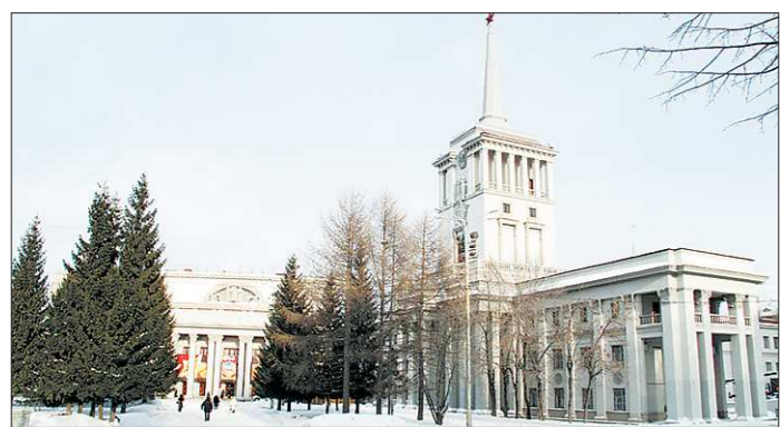
Официально Дом офицеров от тепла отключён, но батареи в здании тёплые

Кстати, первым резидентом и кадры на своё новое производство будет набирать пророчески: кто раньше начнёт, тот и снимет сливки с местного рынка труда.