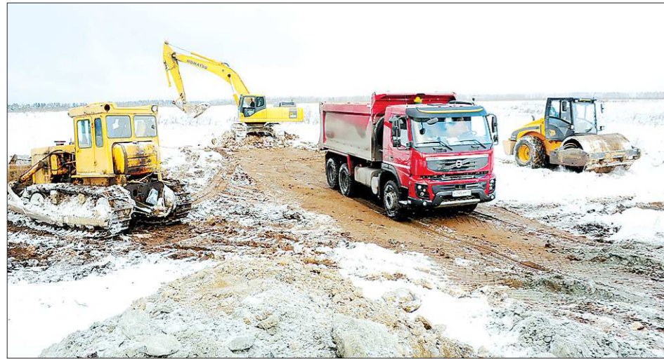
Экспедиторы и бульдозеры снимают первые кубометры грунта, отсчёт стройки пошёл

+/- — рост / падение по отношению к предыдущему показателю