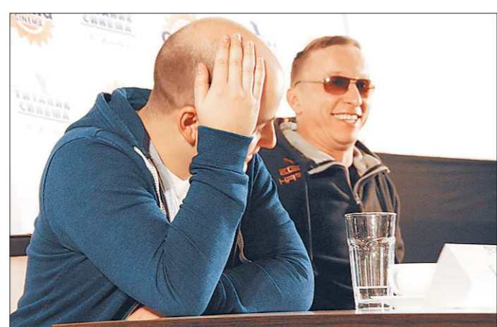
Екатеринбург стал первым городом, которому Егор Баранов (слева) и Иван Охлобыстин презентовали свою новую работу

меняющийся предмет. В прямом и переносном смысле. По скромным подсчётам гражданских авиаперевозчиков, в каждой российской компании из-за пьяных дебоширов случается до тысячи ЧП в год. Авиаторы и обратились в Минтранс с просьбой пролоббировать методы борьбы с зелёным змием. Идея-то не нова. В самолётах советского Аэрофлота не предлагали горячительных напитков. Пронести алкоголь с собой не разрешали. Ныне в США, Китае и многих европейских странах не жалуют авиапассажиров с початой бутылкой спиртного. В зоне дьюти-фри попросту не выдают купленный алкоголь на руки, а отправляют его в упаковке вслед за пассажиром в салон самолёта. Человек получает товар по квитанции после приземления.