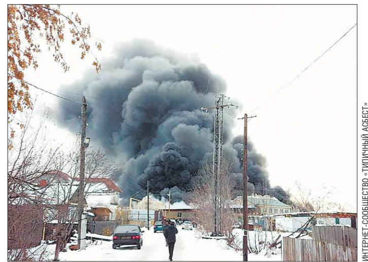
От горящего ангара с матрацами была задымлена вся окрестность

«Думаю, что результаты будут через неделю-две, - сказал заместитель прокурора Первоуральского городского округа.