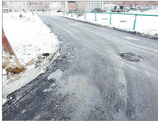
Ровно год назад такую картину екатеринбуржцы наблюдали на улице Черепанова, 16. Через пару дней, когда потеплело, дорога превратилась в кашу из грязи и битума