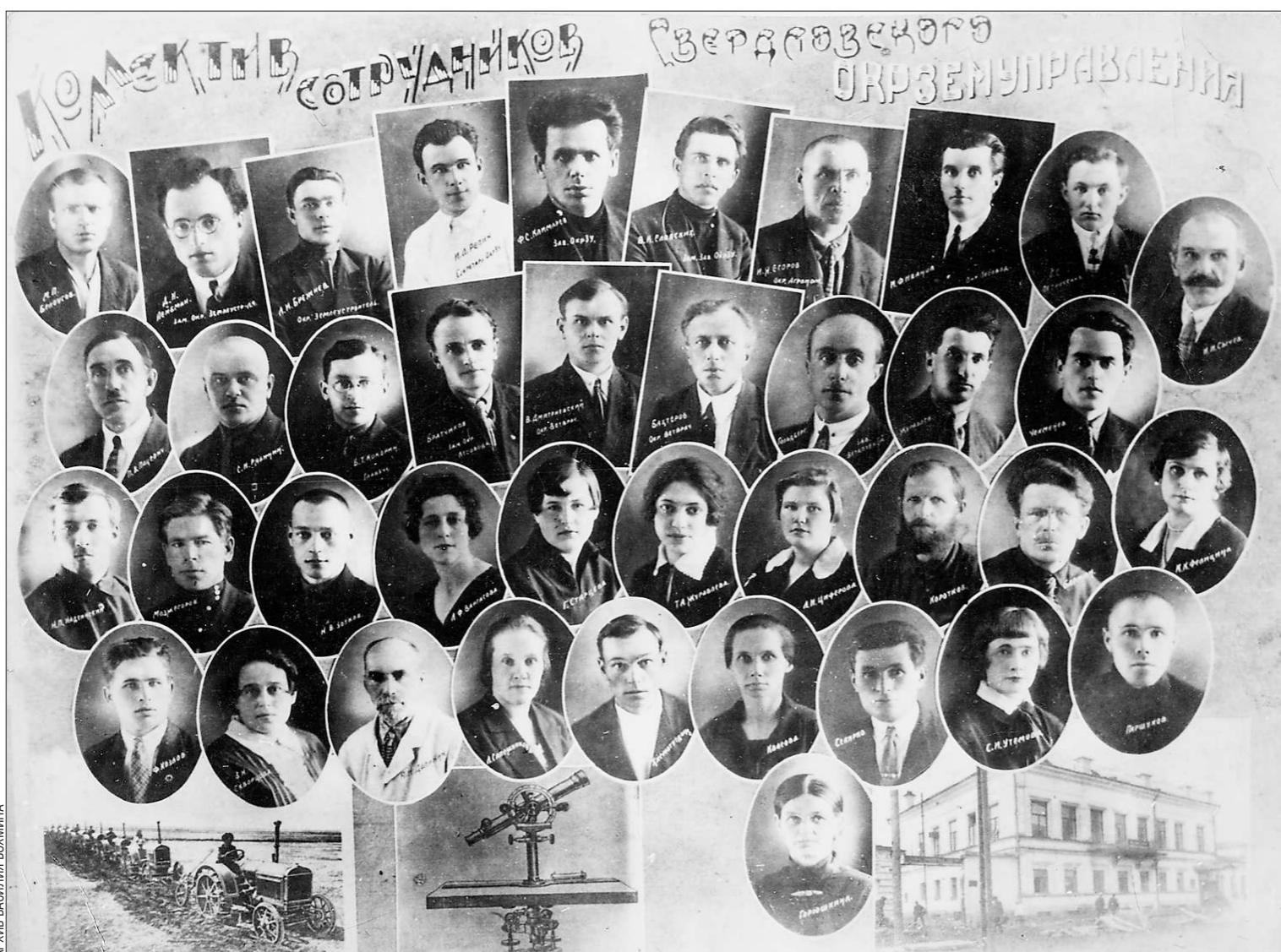
В течение 18 лет Леонид Брежнев возглавлял галерею портретов советских вождей. На этом снимке 23-летний свердловчанин Лёня Брежнев совсем не главный, но уже – в верхнем ряду. Спустя считанные месяцы его головокружительная уральская карьера превратится самым загадочным образом. Впрочем, перебарывая на Украину, он повторит свой фантастический взлёт.