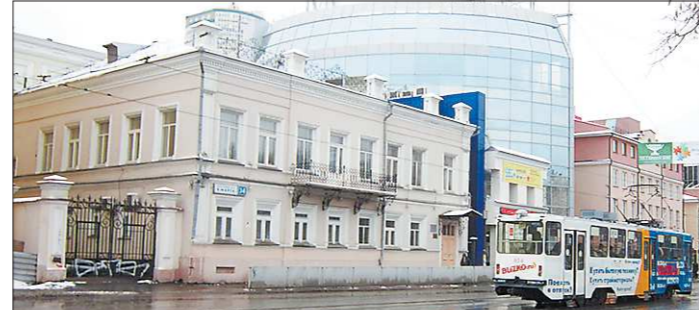
Под окнами дома на улице 8-го Марта, 34, как и в 1930-м, ходят трамваи. В 80-е годы на этом здании висела табличка, сообщающая, что здесь работал «выдающийся деятель коммунистической партии и советского государства»

Бюрократический режим, во главе которого оказался Леонид Брежнев, не был чем-то необычным для многовековой российской истории. Но в каком-то смысле традиции бюрократии в это время были доведены до абсурда: любой самый незначительный вопрос требовал десятков согласований, экономку опутывали тысячами инструкций, а решение назревших проблем могло