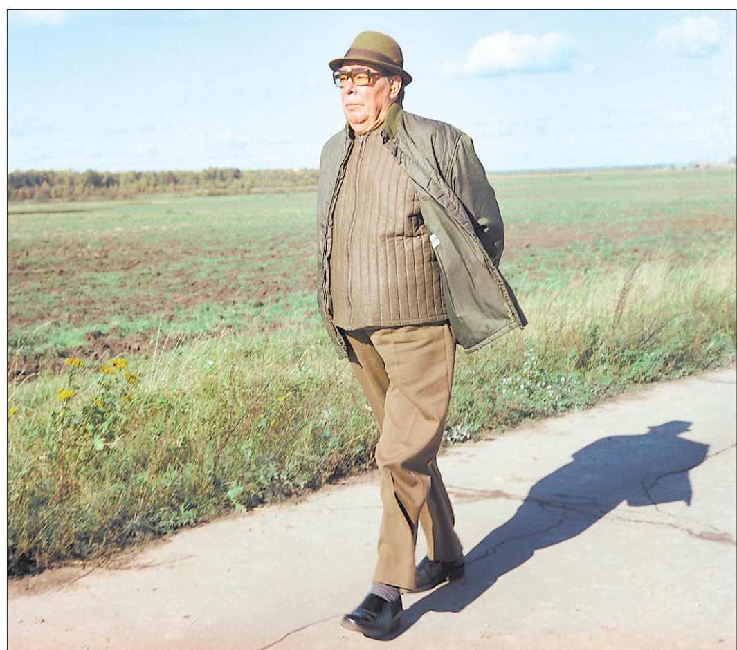
Генсек прогуливается по окрестностям своей ближней подмосковной дачи в Заречье? Или дальней – в Завидово? И не вспоминаются ли ему километры, пройденные по уральским полям в конце 20-х годов? Фото датировано октябрём 1979 года

Суслов умирает от инсульта, а Кириленко поражает старческое слабоумие. Брежнев доживает последние месяцы, путая в своих речах Азербайджан с Афганистаном. Однако властного инстинкта генсеку вполне хватает на то, чтобы не выделять кого-то одного: на работу в ЦК из КГБ переводится Юрий Андропов, но все хорошо знает, что не меньшей властью обладает много-