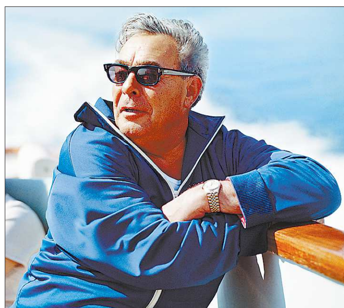
Любимый снимок Леонида Ильича, сделанный в Крыму в августе 1971 года. «Я здесь как Аллен Делон», – говорил генсек, глядя на эту фотографию

«Народ, на худой конец, отвернётся от государя, тогда как