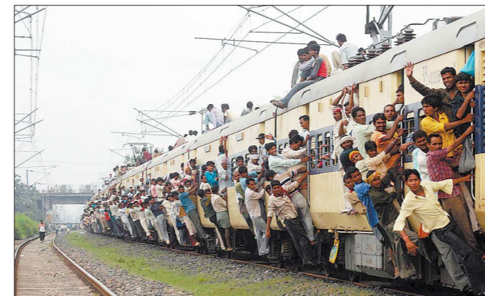
Индия занимает четвёртое место в мире по развитию железнодорожной сети и темпам роста ВВП

«Психология. Боятся. Боятся, что не знают правил игры, замирают в знакомом сегменте, в своей нише, региональной географии, где всё понятно и знакомо. А сидеть на месте нельзя, надо двигаться! Бизнес должен уметь рисковать. Крупным предприятиям с одной стороны проще, у них есть «специально обученные люди», департаменты и отделы, которые занимаются внешнеэкономической деятельностью, больше информации и возможностей. Но! На гло-