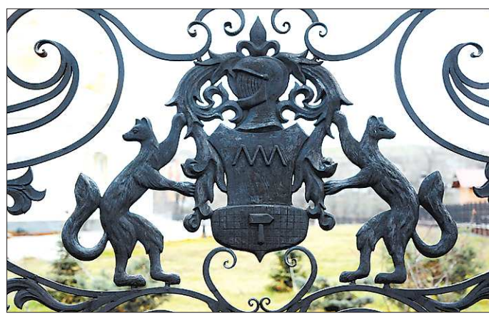
Герб рода Демидовых

Аналогична история и с затоплением. Подвалов в красивы-башни нет, установили исследователи, и никогда не было. А вот в бывших господских хоромах (что размещаются буквально в двух шагах от башни) подвалы наличествуют. Собственно, от хороши они только и остались. Однако история о том, как в демидовских подвалах накануне проверки утопили каторжных умельцев, оказалась на редкость живучей. Спустя триста