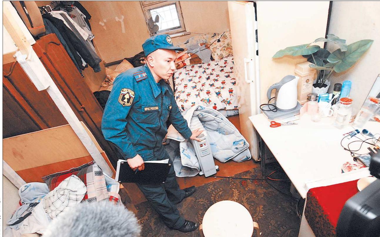
Дом на Фестивальной, 8 не приспособлен для жилья. Он и так может загореться в любую секунду, а мигранты усугубляют ситуацию: на работающий обогреватель положили одеяло

В ходе рейда на одну из точек проверяющих просто не