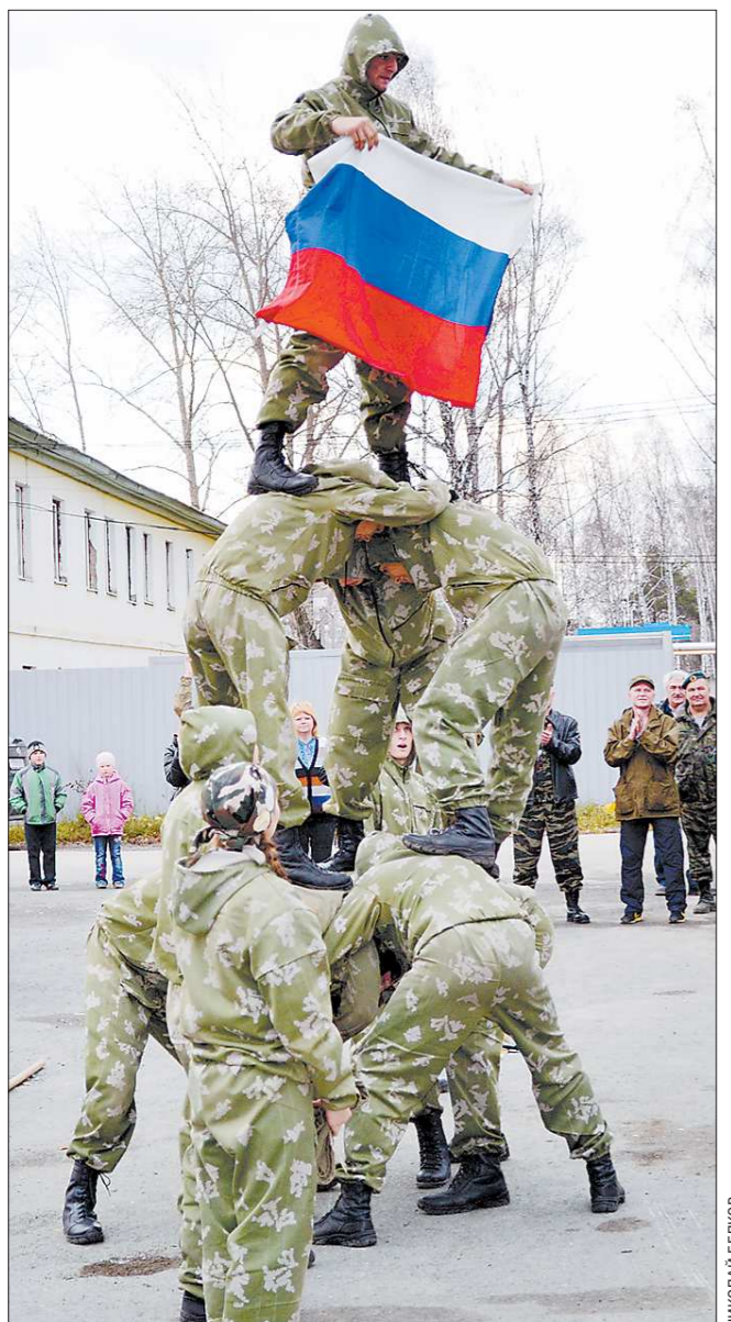
В Верхней Пышме накануне Дня подразделений специального назначения прошли соревнования, в которых приняли участие ветераны Свердловской областной общественной организации инвалидов войны в Афганистане, «Союза десантников России» и других организаций ветеранов локальных войн и военных конфликтов. Ветераны спецназа вновь доказали, что они – самые сильные