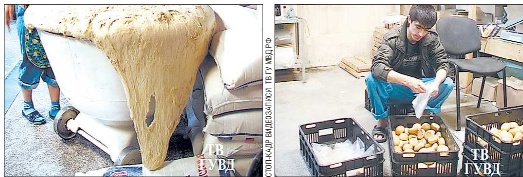
А эти кадры были сняты в Екатеринбурге накануне упомянутого выше рейда. На улице Титова полицейские «накрыли» подпольную пекарню, которая служила мигрантам одновременно и общежитием

пустили. Инспекторы, приехавшие к ООО «Стройиндустрия» (Коммунистическая, 50), увидели табличку... с названием другого юридического лица. Старую, кстати, даже снимать не стали, висела в метре от новой. Можно только позавидовать спокойствию, с которым директор компании вежливо попросил инспекторов переделать документы на проверку новой компании. По закону он прав. Для любого рейда нужны разрешитель-