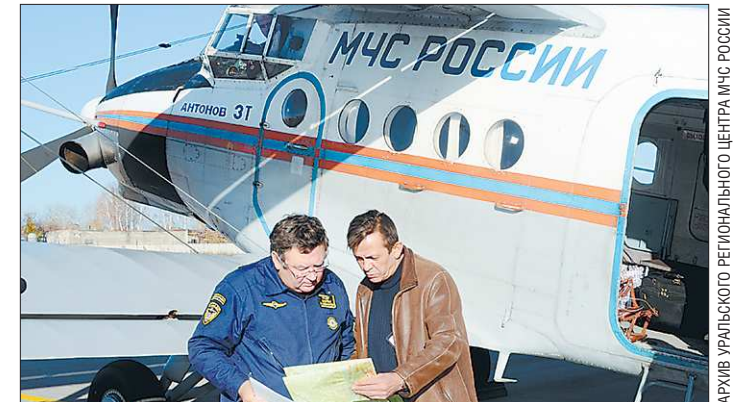
Лётчики самолёта Ан-3 изучают топографические карты района поисков: уйдёт непогода, и из воздушных следопытов начнутся горячие денёк