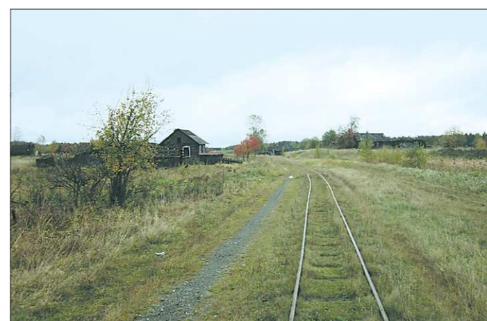
В 1970-е годы протяжённость Алапаевской узкоколейной дороги составляла почти 600 километров. На сегодняшний день — около 250-ти...