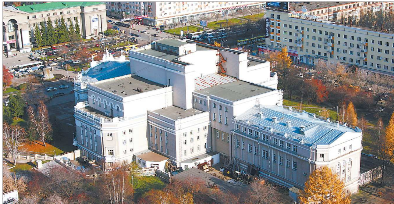
С этого ракурса Оперный театр мало кому знаком. Фото со смотровой площадки делового комплекса «Антей»