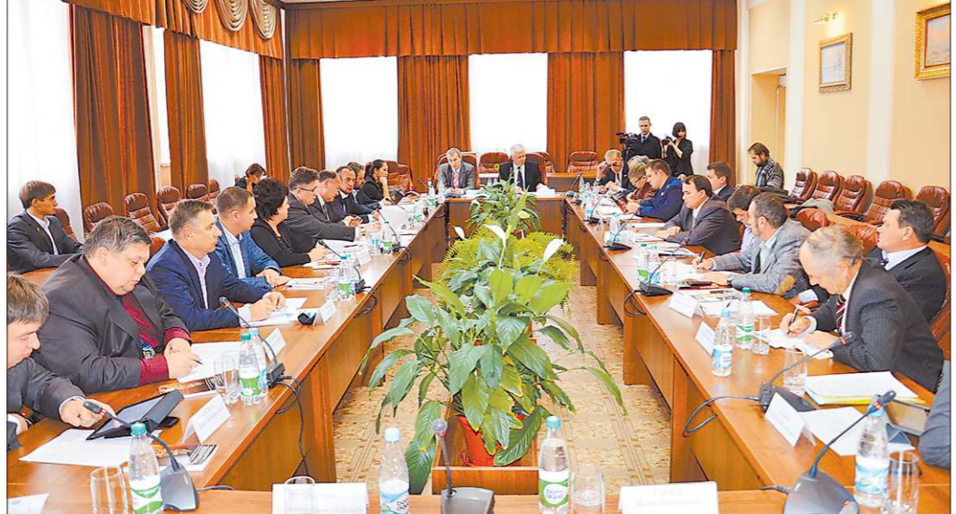
Подобные «круглые столы» теперь будут регулярными. Следующее заседание пройдёт в конце года

Представители бизнеса, власти, силовых структур и юридического сообщества собрались за «круглым столом», чтобы обсудить, какие меры можно предпринять уже сегодня, чтобы давать взятки было невыгодно да и незачем.