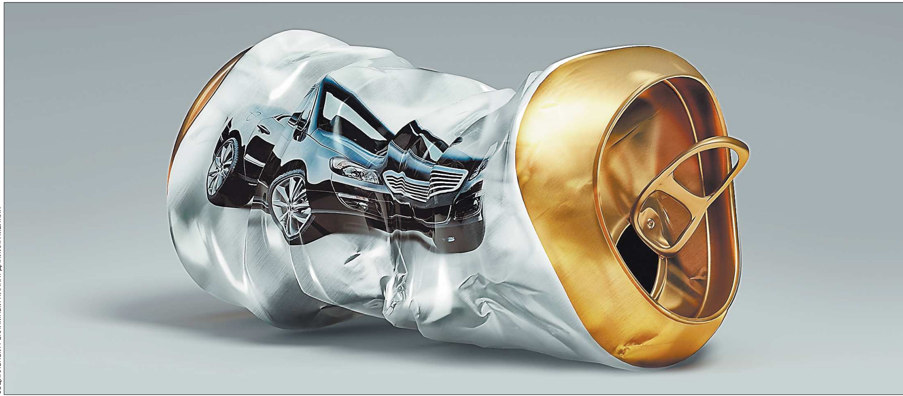
СОЦИАЛЬНЫЙ РЕСОНАНСНЫЙ ПЛАКАТ ДАНИИЛА МЕЛЮКА

Катастрофический всплеск тяжких последствий автомобильных аварий — диагноз нашего времени. Терапевтическое лечение здесь бесполезно.